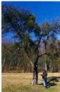
Trás 4. Ústředí Čestláka mála

Trás 4. Ústředí Čestláka mála, Ústředí 2. ústředí ÚO Oberhausen, je vskutku unikátní. Vlastně je to ústředí, které má v sobě mnoho vzpomínek na dřívější mládí, když jsme s přáteli a rodinou chodili do lesů, aby se tam jenom tak zablábali a bavili.