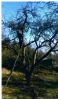
Trás 4. Ústředí Čestláka mála